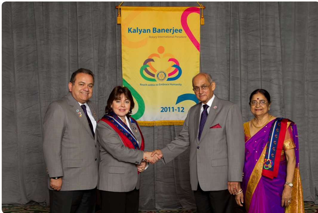
María Ester López Gobernadora del Distrito Rotario 4360 saluda al Presidente de Rotary International Kalyan Banerjee, ambos acompañados de sus respectivos cónyuges.